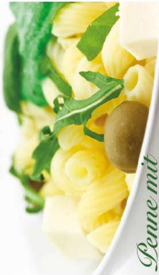
Penne mit Rucola-Minz-Pesto