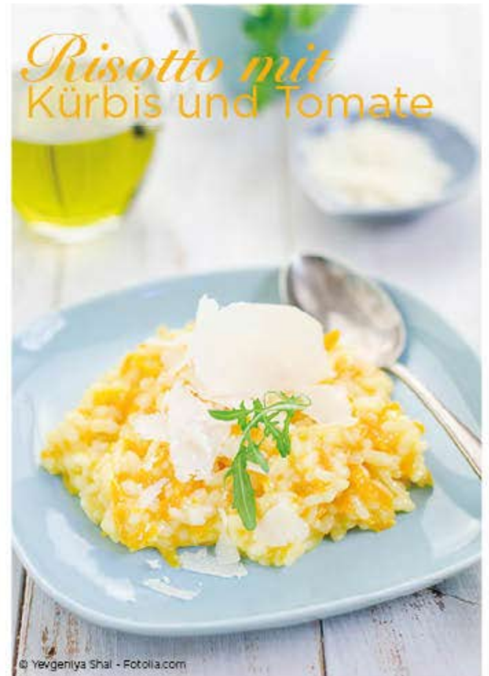
Risotto mit Kürbis und Tomate